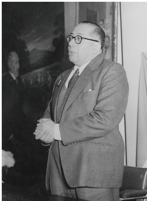
Ramón Carrillo en un acto en el Instituto de Neurocirugía "Costa Buero".