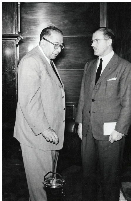
Ramón Carrillo con el rector de la Universidad de Buenos Aires, Jorge Alberto Taiana, en la clausura del Congreso de Antibióticos y Quimioterápicos. 29 de noviembre de 1952.