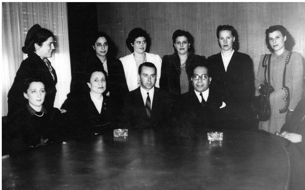
Ramón Carrillo en una reunión con enfermeras. 9 de octubre de 1947.