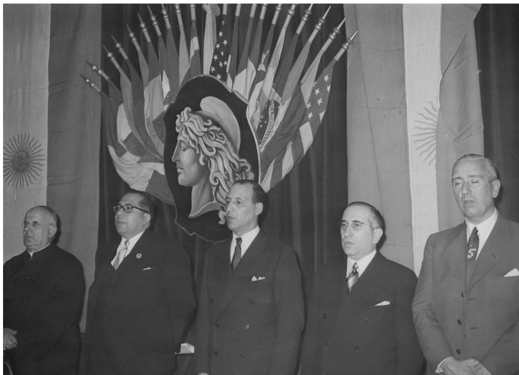
Ramón Carrillo, el cardenal Santiago Luis Coppello, el ministro de Relaciones Exteriores Juan Atilio Bramuglia, el ministro de Justicia Ángel Borlenghi y el ministro de Agricultura Carlos Emery; en el Congreso Panamericano de la Salud. 24 de setiembre de 1947.