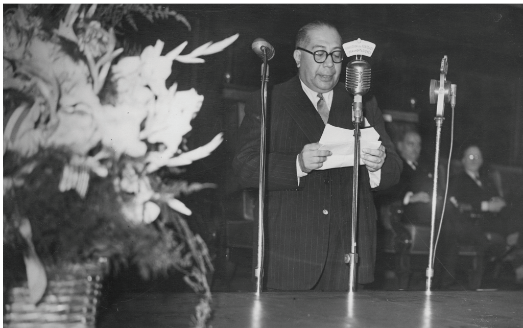
Ramón Carrillo en la inauguración del 7º Congreso Interamericano de Cirugía.