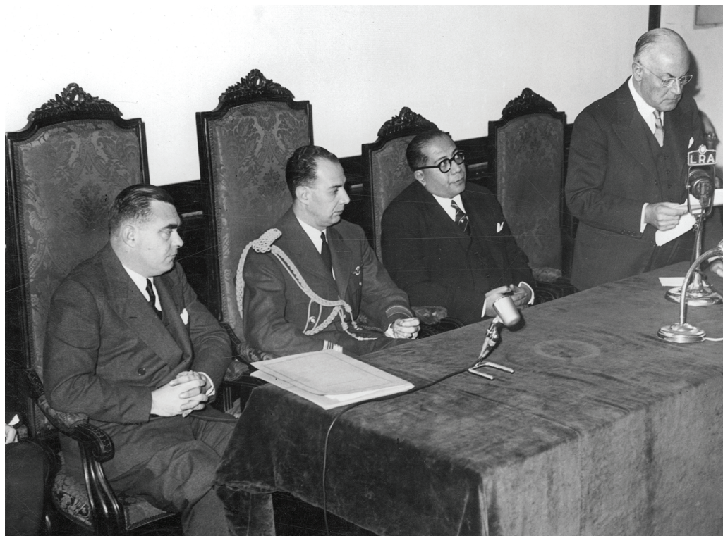
Ramón Carrillo en la apertura del Primer Congreso Argentino de Medicina del Trabajo. 15 de mayo de 1948.