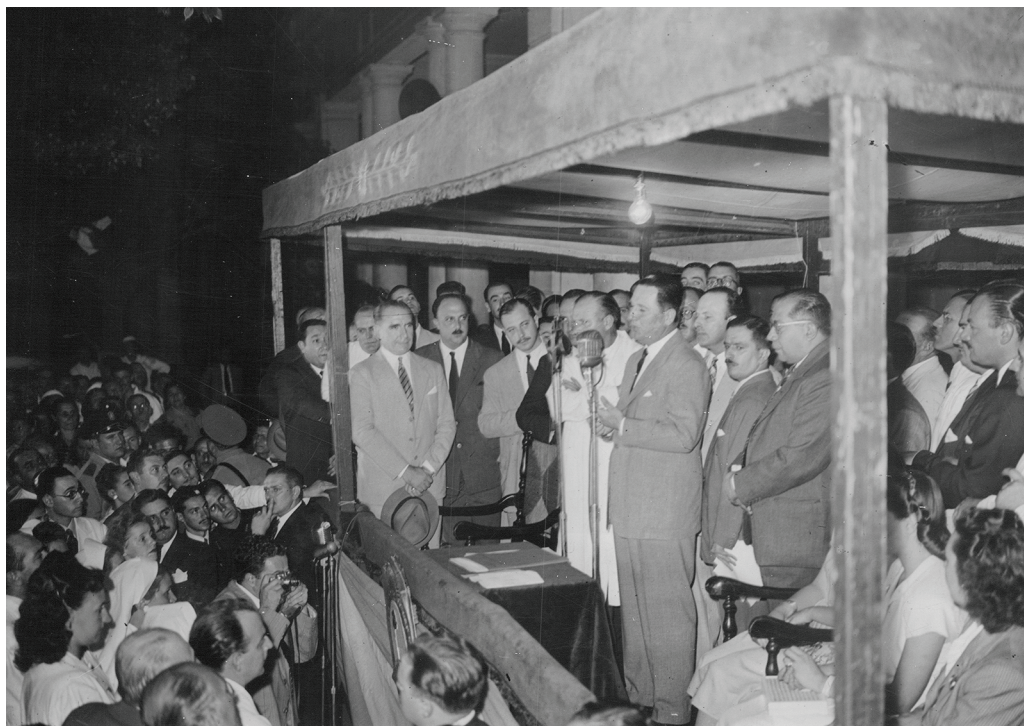
El presidente Juan Domingo Perón y Ramón Carrillo en un acto de entrega de nombramientos a médicos en el Hospital Nacional de Salud Pública. 4 de marzo de 1947.