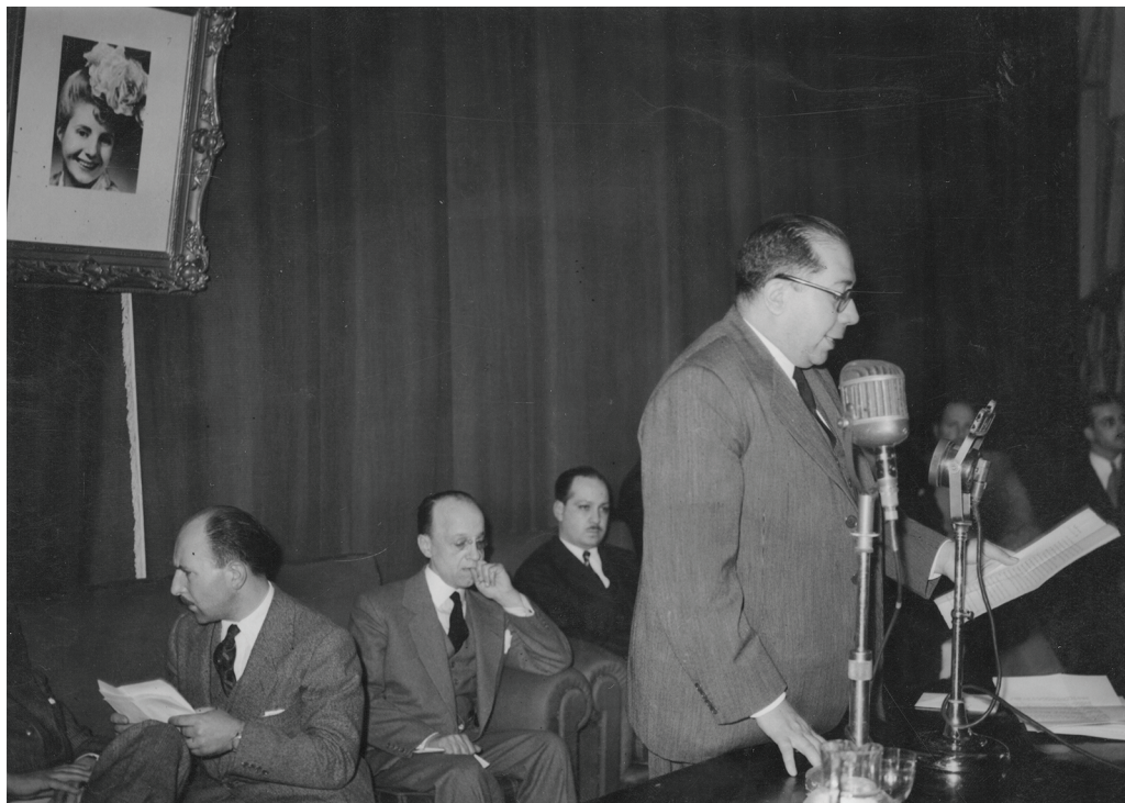
Ramón Carrillo en la celebración del día de la Higiene Social. 8 de septiembre de 1947.