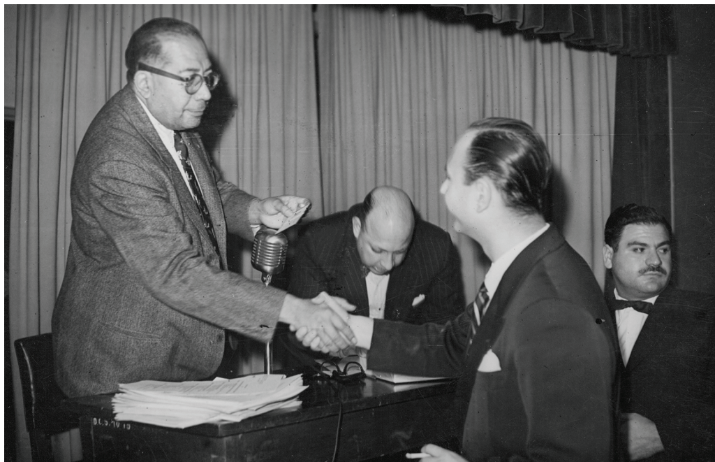
Ramón Carrillo entrega credenciales de cronistas sanitarios en el Congreso de Higiene en Ciudades.