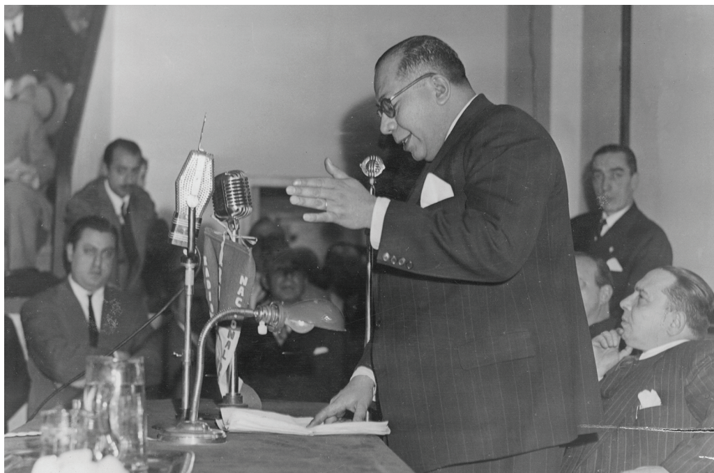
Ramón Carrillo habla por Radio Belgrano.