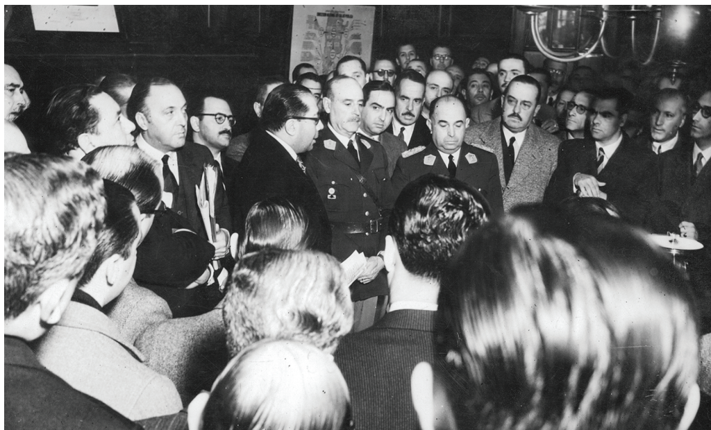
Ramón Carrillo se hace cargo de la Secretaría de Salud Pública. 1 de junio de 1946.