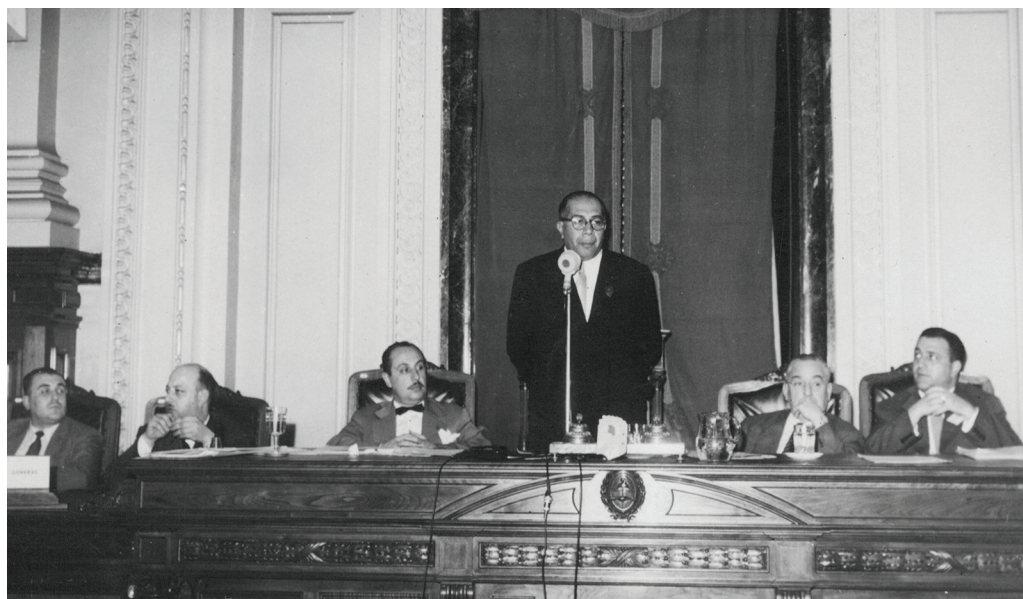
Ramón Carrillo en la clausura del 1er Congreso Argentino de Racionalización Alimentaria. En el Aula Magna del Colegio Nacional de Buenos Aires. 29 de noviembre de 1952.