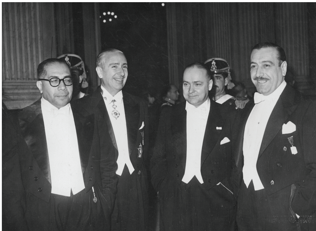
Ramón Carrillo en el Teatro Colón, con el ministro de agricultura Carlos Emery, el subsecretario de Información Raúl Apold y el presidente de la Cámara de Diputados, Héctor Cámpora, en el 133 aniversario de la declaración de la independencia. 9 de julio de 1949.