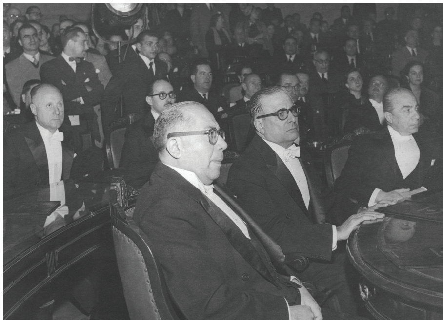
Ramón Carrillo, junto a los ministros Natalio Palacios, de Justicia, Jerónimo Remorino, de Relaciones Exteriores, Roberto Dupeyron, de Obras Públicas y Miguel Revestido, de Finanzas, durante la lectura del mensaje presidencial del 1 de mayo de 1953.