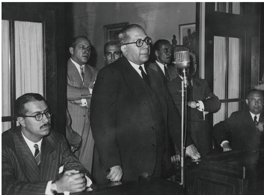
Ramón Carrillo en el acto de inauguración de cursos de minería realizados en instalaciones del colegio Mariano Moreno. 15 de abril de 1947.

Era mi propósito al inaugurar, en esta aula magna de nuestra Facultad de Medicina, el primer curso oficial de Medicina del Trabajo, dictar una clase sobre el tema, aprovechando la presencia de alumnos cuya concurrencia descontaba. Sin embargo, y tal vez porque se ha reconocido la importancia de la cátedra, me encuentro ante un auditorio de selección. Reconozco entre mis oyentes a funcionarios de alta jerarquía, profesores distinguidos en todas las especialidades y un plantel de rostros nuevos en quienes adivino sin dificultad los colegas de un mañana cercano.