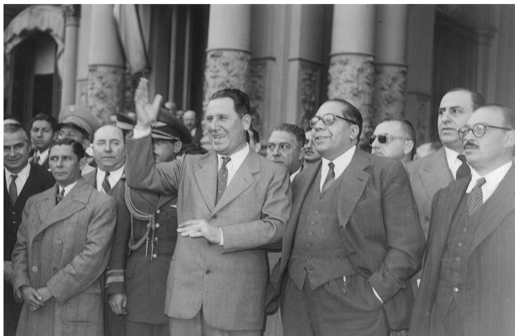
El presidente Juan Domingo Perón y Ramón Carrillo en la partida de camiones a una campaña de salud pública.

El 2 de agosto de 1946, por iniciativa del excelentísimo señor presidente de la nación, general Juan Perón, se dictó el Decreto 5289, con el propósito de concretar un plan de saneamiento que encare de una vez por todas viejos y aparentemente insolubles problemas que afectan directamente a la salud de la población de los centros urbanos y suburbanos y principalmente a la del Gran Buenos Aires.